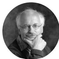
Erik Orsenna Ecrivain & académicien