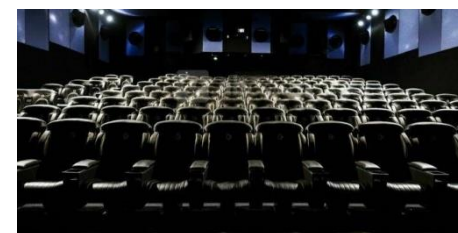
Salle Le Fliers / Rang-du-Fliers