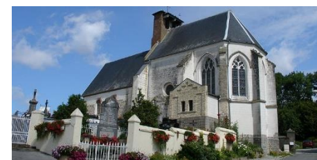
Eglise Saint-Martin / Attin