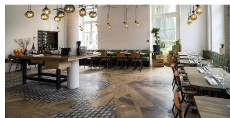
Anecdote / Montreuil