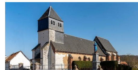
Eglise La Nativité de ND / Inxent