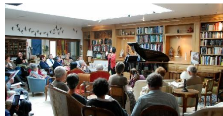
Salon Musica Nigella / Tigny-Noyelle