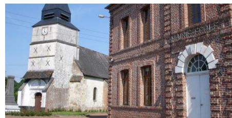
Eglise Saint-Martin / Tortefontaine