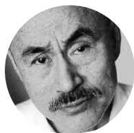
Yoshi Oida Acteur & Metteur en scène