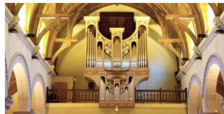
Eglise Ste Jeanne d'Arc / Le Touquet