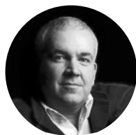
Marc Minkowski Chef d'orchestre