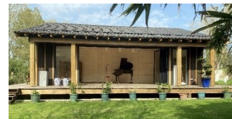
Closerie des Iris / Tigny-Noyelle