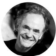
Jean-Claude Casadesus Chef d'orchestre Président d'honneur

Personnalités artistiques qui nous soutiennent