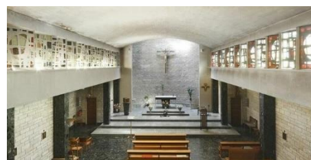
Chapelle de l'Institut Calot / Berck