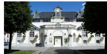
Théâtre / Montreuil